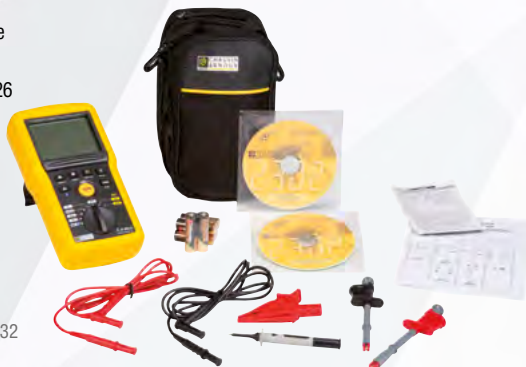
Esempio per il C.A 6532

C.A 6536, idem C.A 6524 + 2 sonde a pinza (rosso e nero).